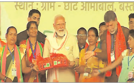
स्थान: ग्राम - छाट आमाबाब, बस्तर

नई दिल्ली (एजेंसी)। आजादी के बाद पूर्वोत्तर राज्य दशकों तक हार्डिप पर रहे। कांग्रेस सरकारों ने वहां के लोगों के साथ सौतेला व्यवहार किया। हमने इस धारणा को बदला कि पूर्वोत्तर बहुत दूर है। आज पूर्वोत्तर नदिल्ली से दूर है और न दिल से दूर है। पूर्वोत्तर ने दुनिया को दिखाया है कि जब नीयत सही होती है, तो नतीजे भी सही होते हैं। प्रधानमंत्री नरेंद्र मोदी ने एक इंटरव्यू में ये बातें कहीं। उन्होंने नॉर्थ-ईस्ट की चुनौतियों और उससे निपटने के लिए केंद्र की पहल पर चर्चा की। उन्होंने असम में उग्रवाद, अरुणाचल प्रदेश को लेकर चीन के दावे, मणिपुर हिंसा, नगालैंड में राजनीतिक संघर्ष और मिजोरम में घुसपैठ की समस्या पर बात की। मोदी ने कहा कि अरुणाचल प्रदेश भारत का हिस्सा है और रहेगा। इसमें कोई संदेह नहीं होना