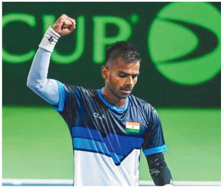
भारतीय टेनिस स्टार सुमित नागल ने

नई दिल्ली, एजेंसी। इंडियन प्रीमियर लीग 2024 में अबतक किसी खिलाड़ी ने सबसे ज्यादा प्रभावित किया है तो वह लखनऊ सुपर जायंट्स (रॉयल) के तेज गेंदबाज मयंक यादव हैं। 121 साल के तेज गेंदबाज मयंक ने अपनी रफ्तार को कोहराम मचाकर रख दिया है। वह 150 किलोमीटर प्रतिघंटे से ज्यादा की रफ्तार से गेंद करते हैं। लगातार इस गति से गेंद डालने की क्षमता रखते हैं। हालांकि, गुजरात टाइटंस के खिलाफ रविवार (7 अप्रैल) को खेले गए मैच में वह सिर्फ 1 ओवर ही कर पाए। इस ओवर के बाद उन्हें मैदान छोड़कर बाहर जाना पड़ा। इसकी वजह चिंता बढ़ाने वाली रही